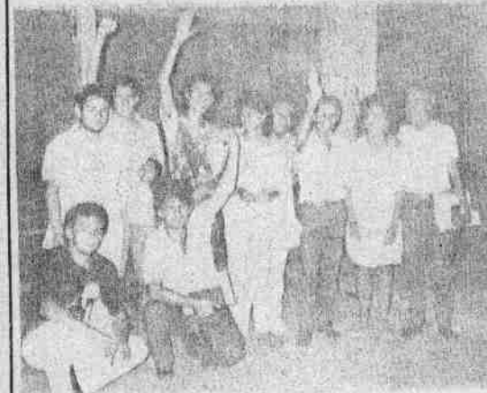
ESTUDANTES: DCE INTERFERE