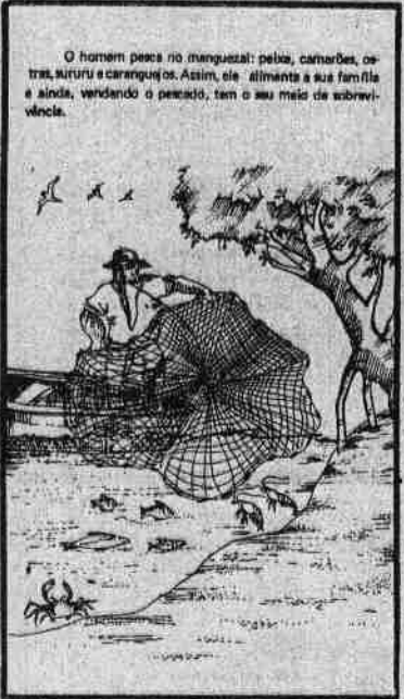
O homem pesca no manguezal: peixes, camarões, ostras, sururus e caranguejos. Assim, ele alimenta a sua família e ainda, vendendo o peixeiro, tem o seu meio de sobrevivência.

Medidas enérgicas devem ser tomadas pela secretaria estadual do Meio Ambiente, pela Capitania dos Portos do Piauí, pela prefeitura