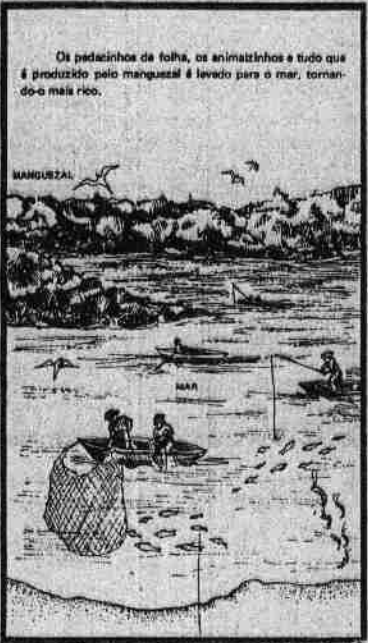
Os pedacinhos de folhas, os animatizinhos e tudo que é produzido pelo manguezal é levado para o mar, tornando-o mais rico.