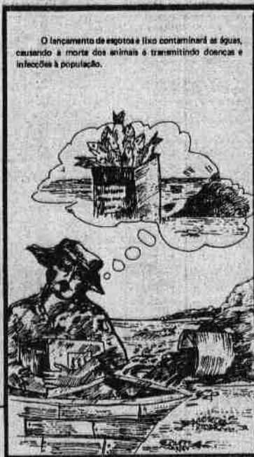
O lançamento de esgotos e lixo contaminará as águas, causando a morte dos animais e transmitindo doenças e infecções à população.