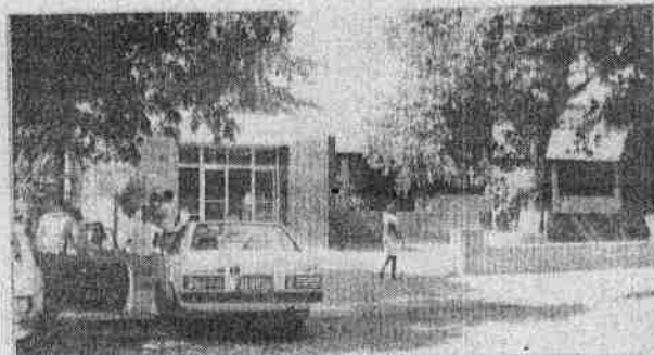
HOSPITAL E MATERNIDADE N.S. DE FÁTIMA