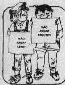
... proteger os manguezais?