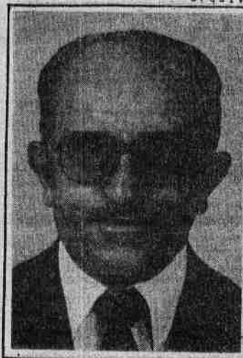
LAURO: PARA O BAÚ

A sociedade civil quer o Porto de Luis Correia; a Rodovia Litorânea; Ferrovia e Aeroporto Irrigação; Distrito Industrial a pleno vapor; a Universidade Federal do Delta do Parnaíba com cursos de agronomia e pesca; e, revisão do Plano Diretor da cidade.