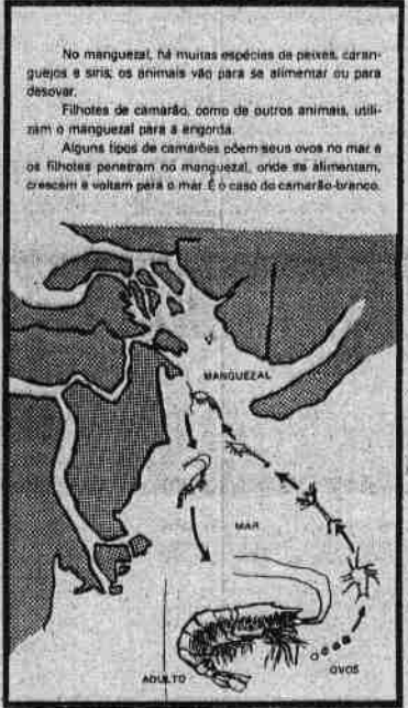
No manguezal, há muitas espécies de peixes, caranguejos e siris, os animais vão para se alimentar ou para desovar.