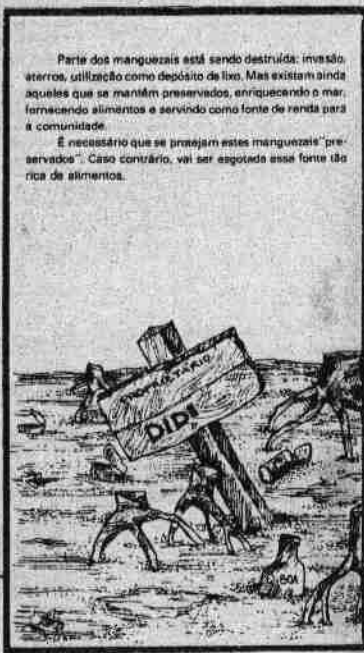
Parte dos manguezais está sendo destruída: invasão, aterros, utilização como depósito de lixo. Mas existem ainda aqueles que se mantêm preservados, enriquecendo o mar, fornecendo alimentos e servindo como fonte de renda para a comunidade.