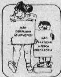
Como podemos ...